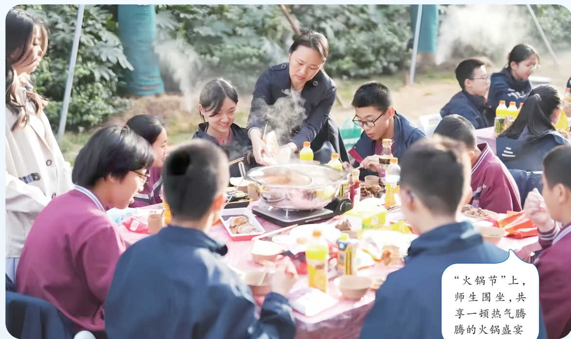
“火锅节”上,师生围坐,共享一顿热气腾腾的火锅盛宴