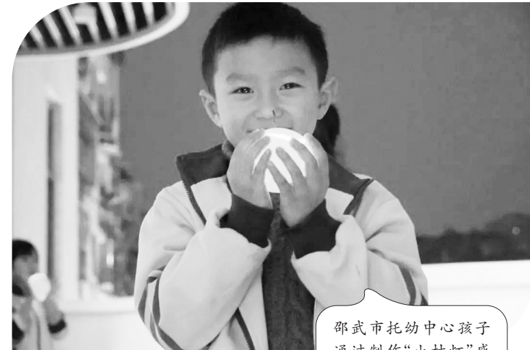
邵武市托幼中心孩子通过制作“小桔灯”感知《小桔灯》的故事

序。孩子们早早地为这半天的阅读时光做好了准备:提前思考要去幼儿园的哪个角落、与谁一起、如何装扮自己的阅读空间、要读哪些书……活动开始后,全园孩子便会有条不紊地进入阅读状态。幼儿园的各个角落都能看到不同年龄的孩子——有的和好朋友共读,有的带着弟弟妹妹一起看。在这里,班级之间的空间隔阂与年龄之间的时间壁垒被打破,所有孩子无论班级、不论大小,都在做同一件事:阅读。