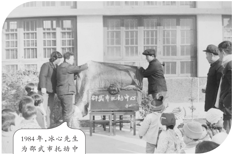
1984年,冰心先生为邵武市托幼中心题写园名

从阅读到写诗,这所大山里的幼儿园孩子,正用他们的童言稚语描绘着丰盈、美好、充满想象与创造的内心世界,编织属于他们自己的“诗意童年”。